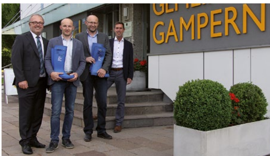
Die Gemeinde Gampern freut sich, dass der Experte im Bereich Böden und Innenausstattung im Bezirk Vöcklabruck – die Firma Dißbacher – sich im Gewerbepark Be One ansiedelt!!

Für die Planung und Örtliche Bauaufsicht wird der bestehende Rahmenvertrag mit dem Planungsbüro Hitzfelder & Pillichhammer aus Vöcklabruck um 5 Jahre zu den gleichen Bedingungen bis Ende 2021 verlängert.