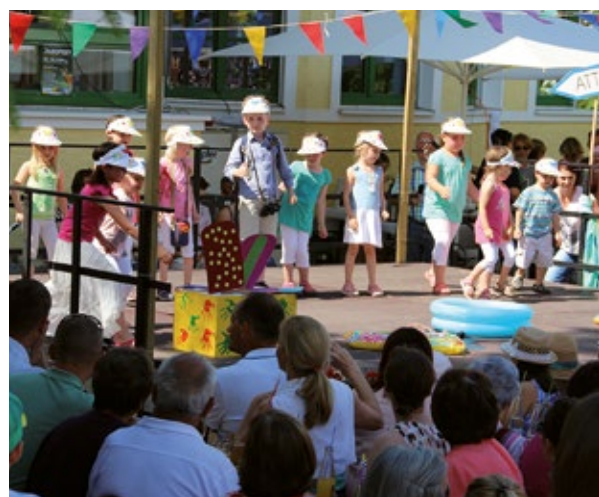
Das Kindergartenfest 2016 stand unter dem Motto „So schmeckt der Sommer“.

mit konnte wieder ein neues Unternehmen für Gampern gewonnen werden. Die noch verbleibende Fläche wird laut den geltenden Optionsverträgen von der Gemeinde Gampern angekauft.