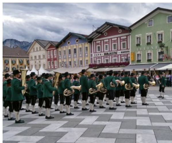
Der Musikverein Gampern bei der Marschwertung am Marktplatz Mondsee.