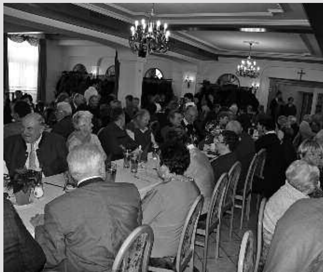
Weihnachtsfeier der Gemeinde für die ältere Generation in Gampern am 11. Dezember 2012