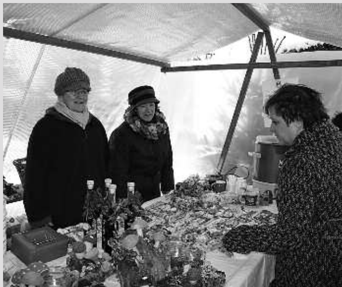
Weihnachtsmarkt am 2. Adventssonntag am Ortsplatz Gampern