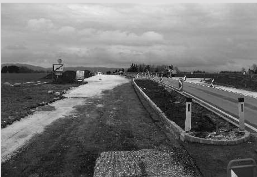
Verkehrssicherheit – 2012 wurde der Linksabbieger zum neuen Siedlungsgebiet Sonnenwiese gebaut.

Mit einem großen Fest im Sommer 2012 wurde das neue LFB der Freiwilligen Feuerwehr Gampern in den Dienst gestellt. Im kommenden Jahr werden die Planung und die Finanzierung für die Erweiterung und Sanierung des Feuerwehrhauses in Baumgarting intensiviert und mit einem Baubeginn ist aus heutiger Sicht 2014 zu rechnen.